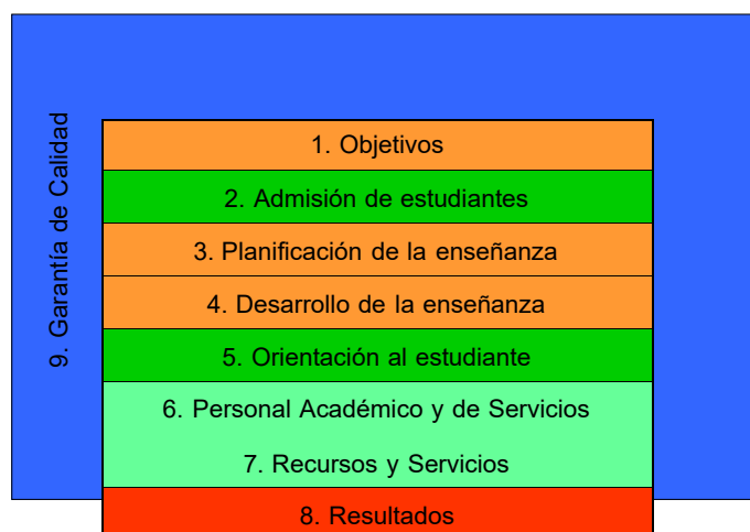
Figura 1. Esquema del modelo de acreditación

La ULPGC, para organizar la gestión de la calidad en los centros universitarios, y con el objetivo de desarrollar las normativas y requerimientos de la ANECA, elabora un reglamento por el cual cada Centro debe confeccionar un Sistema de Garantía de Calidad del Centro a partir de un modelo marco que elaboró el Vicerrectorado con competencias en Calidad. El Sistema de Garantía de Calidad del Centro responde, entre otros, a los requisitos de la ANECA para la acreditación de las enseñanzas oficiales, éstos se articulan sobre la base de 9 criterios de calidad y 46 directrices. La estructura de relaciones que sustenta el modelo se ha construido sobre cinco ejes, cada uno de los cuales hace referencia a uno o varios criterios de calidad, tal y como se presenta en la Figura 1.